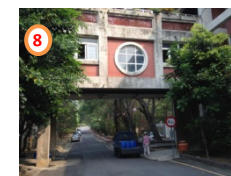
海科院實驗大樓天橋