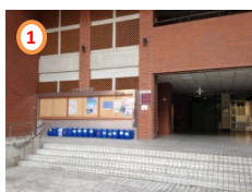
電資大樓一樓玄關北側